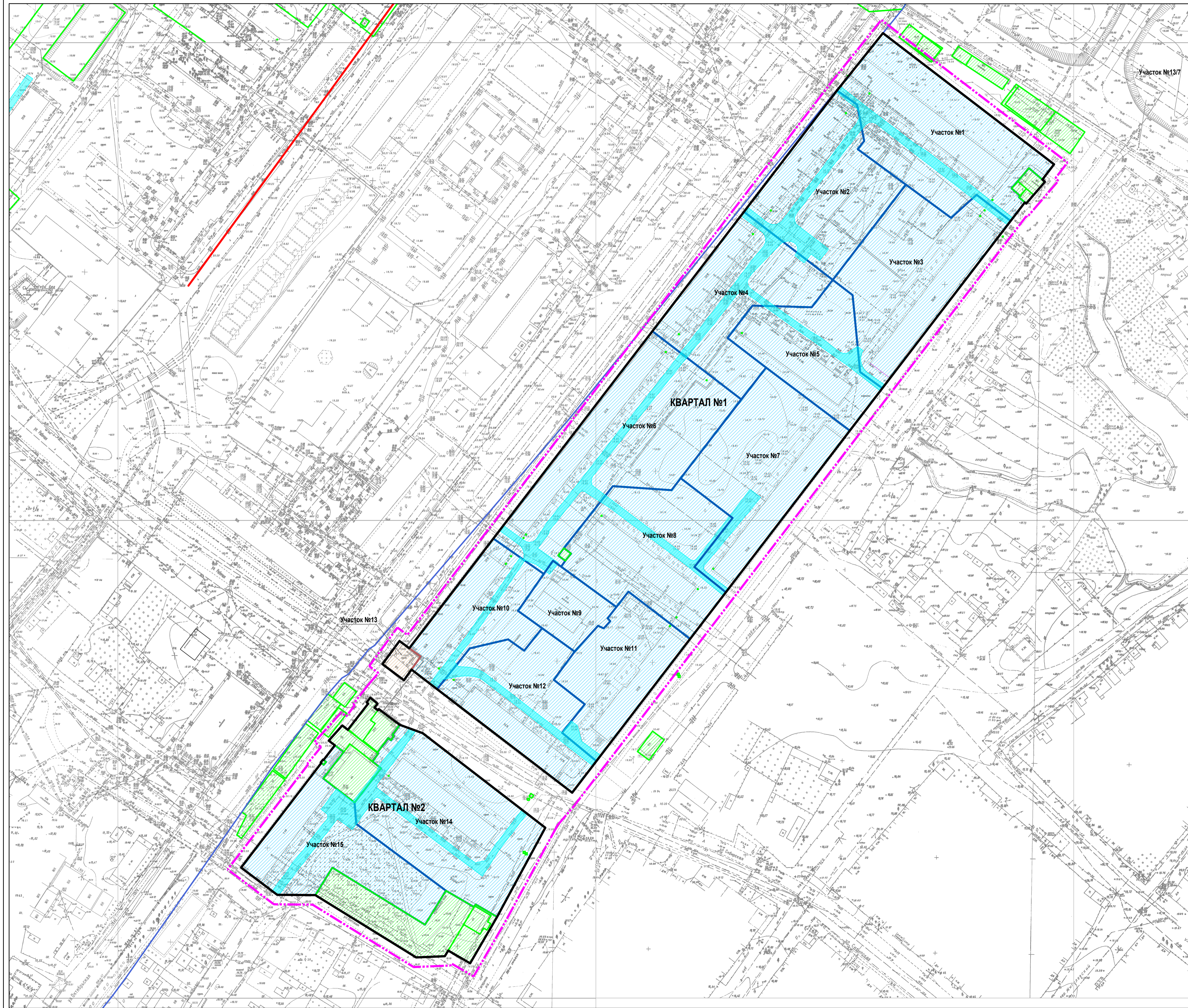
Чертеж межевания территории